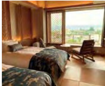
【和モダンツイン】タイプ