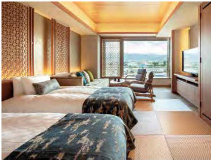
【和モダントリプル】タイプ