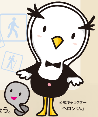
公式キャラクター 「ヘロンくん」

みなさまの健康づくりの一助とするため、 個人専用の健康ポータルサイト「MY HEALTH WEB」を活用しましょう。 健康情報・健康診断の結果等の健康データをいつでも閲覧でき、 健康な毎日の生活にお役立ていただくことができます。